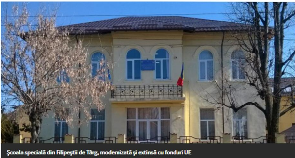
Școala specială din Filipeștii de Târg, modernizată și extinsă cu fonduri UE

Consiliul Județean Prahova pregătește un proiect privind modernizarea și extinderea școlii speciale de la Filipeștii de Târg. Astfel, în cadrul ședinței de mâine a CJ se va aproba pregătirea și promovarea proiectului „Construcția, reabilitarea, modernizarea, extinderea și echiparea infrastructurii educaționale pentru Centrul Școlar de Educație Incluzivă, Comuna Filipeștii de Târg, jud.Prahova”, de către județul Prahova, în vederea obținerii de finanțare nerambursabilă în cadrul Programului Operațional Regional 2014 – 2020.