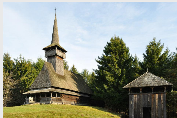
Biserica de lemn din Oncești, comuna Voinești

Biserica de lemn din Oncești este una din multele minuni isvorâte din credința și patima pentru frumos a tărâmului de pe Valea Dâmbovița. De mai bine de două veacuri, un astfel de lăcaș de închinare a fost păstrat cu sfințenie în satul Oncești, din comuna dâmbovițeană Voinești. Biserica de lemn din Oncești, comuna Voinești, județul Dâmbovița, poartă hramul „Duminica Tuturor Sfinților” și „Sfântul Ioan”. Datând din anul 1814, biserica din Oncești prezintă valori documentare și artistice demne de păstrat, mai ales într-o zonă unde numărul vechilor biserici de lemn rămase este redus. Biserica, aflată într-o stare de degradare avansată, este înscrisă pe noua listă a monumentelor istorice. Drept urmare, autoritățile locale au făcut toate demersurile necesare și au reușit să obțină finanțare europeană pentru reabilitarea bisericii de lemn. 4,9 milioane de lei este valoarea proiectului „Reabilitarea, restaurarea și valorificarea turistică a Bisericii de lemn din Oncești, modernizarea și crearea infrastructurii și utilităților conexe”, banii fiind din surse europene. Anul viitor, când vor fi finalizate lucrările de reabilitare, biserica de lemn din Oncești va împlini 200 de ani. Deja s-a început derularea proiectului „Reabilitarea,