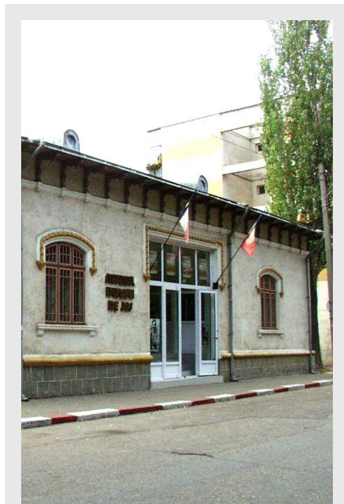
Muzeul Dunării de Jos, Călărași