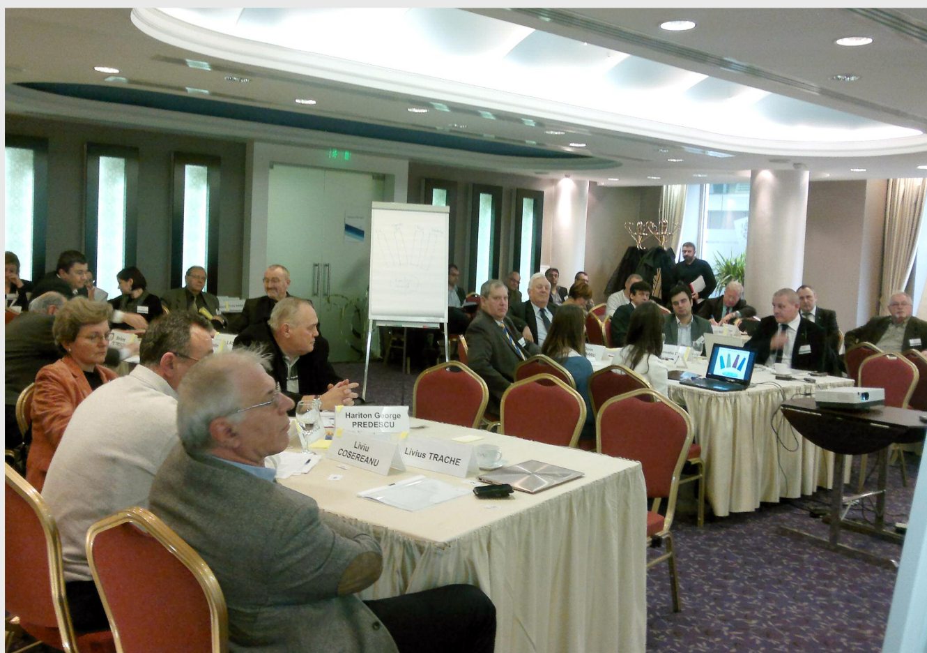
În cadrul evenimentului a fost prezentat procesul consultativ și au fost dezbătute domeniile generice în jurul cărora se vor structura aceste consultări