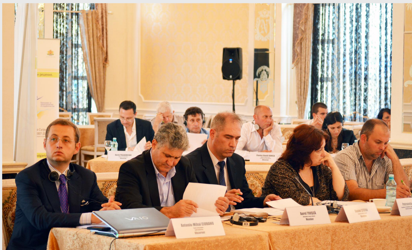
Rolul Comitetului Comun de Monitorizare este de a superviza Programul și de a asigura calitatea și eficacitatea implementării acestuia

Conform regulamentelor europene privind instrumentele structurale, Comitetul Comun de Monitorizare are rolul de a superviza Programul și de a asigura calitatea și eficacitatea implementării Programului și a proiectelor din cadrul lui. Comitetul a fost înființat și este alcătuit din reprezentanți la nivel național, regional și local ai celor două state.