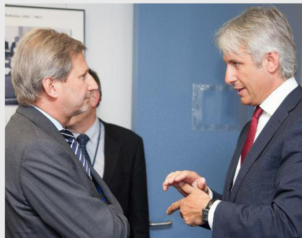
Eugen Teodorovici, ministrul fondurilor europene, a discutat cu reprezentanții Comisiei Europene despre gestionarea fondurilor europene în actuala perioadă de programare

POS Transport și POS CCE sunt încă presuspendate, însă autoritățile române au luat măsurile necesare pentru reluarea plăților de către Comisie în perioada următoare. Ca urmare a măsurilor implemen-