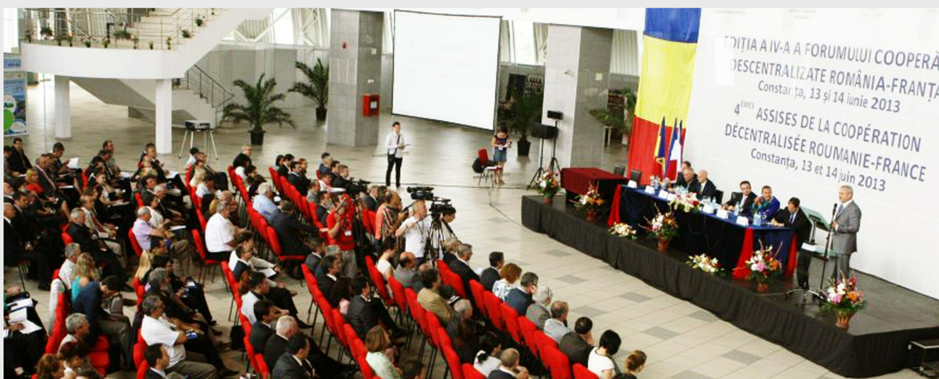
Forumul cooperării descentralizate româno-franceze are rolul de a încuraja cooperarea între autoritățile publice locale din cele două state