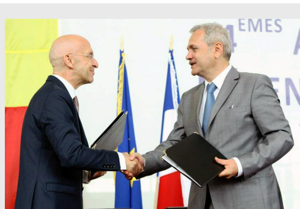
Forumul reprezintă o formă de manifestare a parteneriatului strategic încheiat între România și Franța

Forumul reprezintă o formă de manifestare a parteneriatului strategic încheiat între România și Franța, care s-au angajat, prin acorduri guvernamentale, să sprijine structurile asociative ale autorităților publice locale în dezvoltarea și consolidarea parteneriatelor între comunitățile locale din cele două țări.