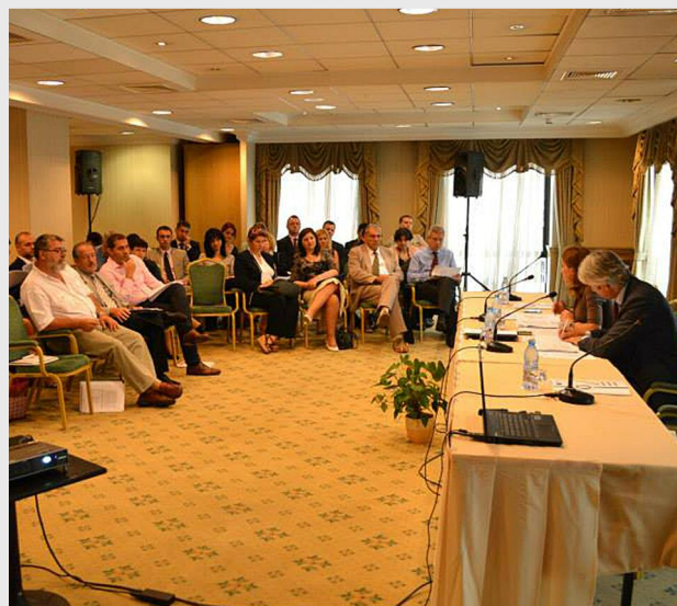
Acordul de Parteneriat 2014 - 2020 va reflecta recomandările Comisiei Europene și prevederile viitoarelor regulamente europene

Prioritățile de finanțare propuse României de către Comisia Europeană vizează îmbunătățirea