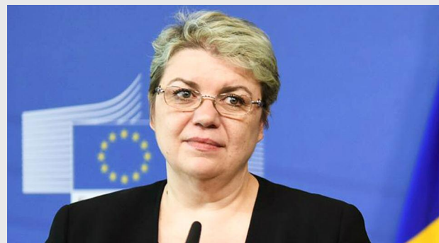
Sevil Shhaideh, ministrul dezvoltării regionale și administrației publice

(...) În ceea ce privește finanțarea cu fondurile europene, România privește astăzi cu multă seriozitate și pragmatism exercițiul financiar pentru perioada 2014-2020. Tocmai din aceste considerente, la nivel național, am demarat toate măsurile necesare pentru implementarea eficientă a fondurilor structurale. Mă refer, în mod special, la Pro-