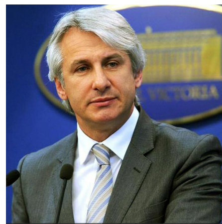
Eugen Teodorovici, ministrul finanțelor publice