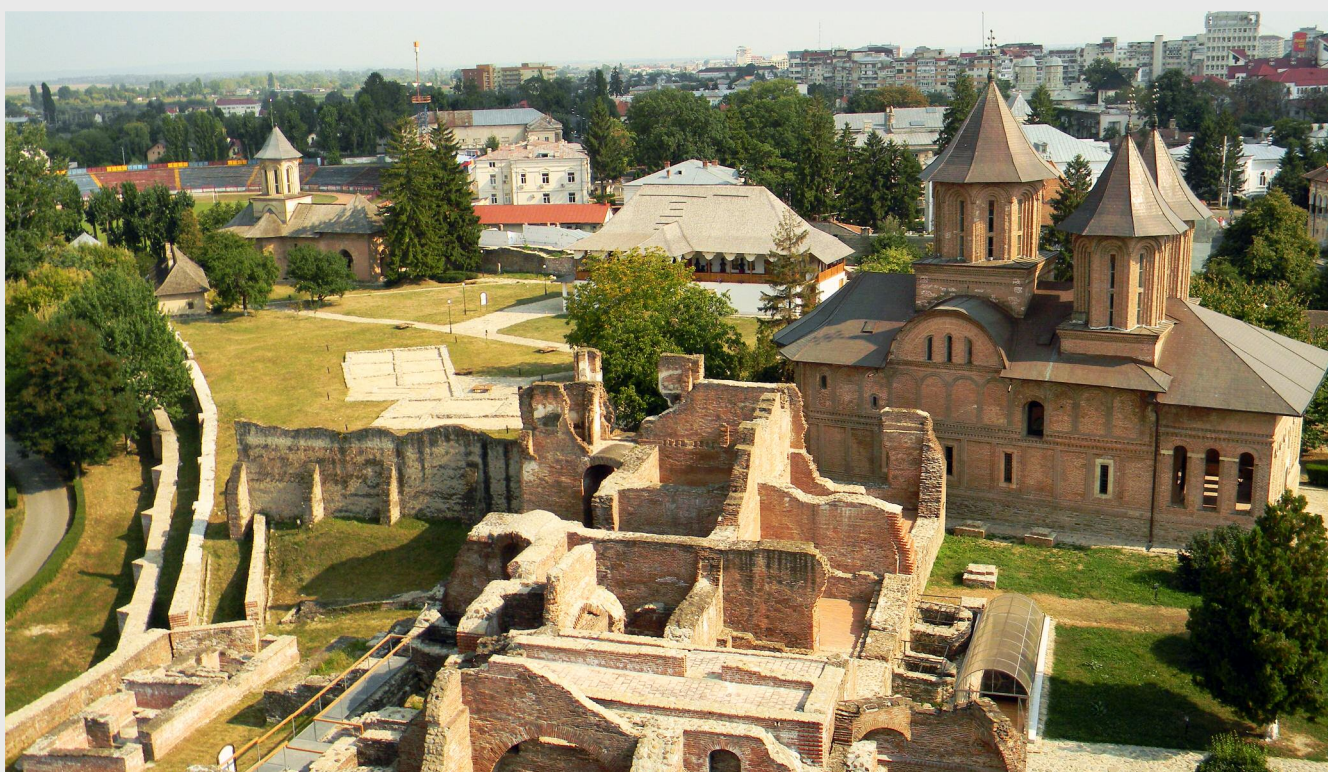
Curtea Domnească din Târgoviște