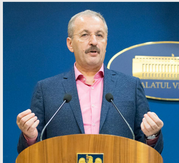
Vasile Dîncu, vicepremierul României

În ceea ce privește reforma administrației, el a adăugat că 2016 este un an în care se pun doar ba-