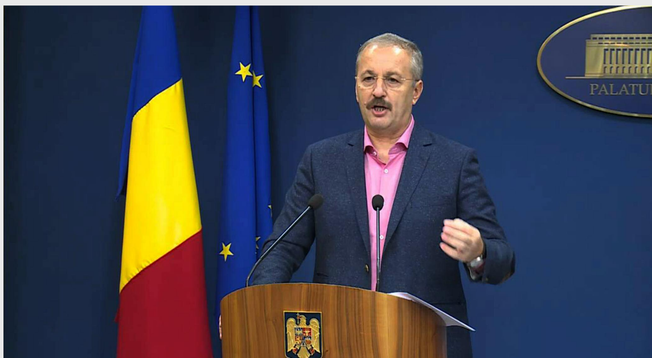
Vasile Dîncu, viceprim-ministrul României