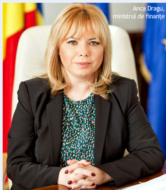
Anca Dragu, ministrul de finanțe