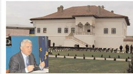
Restaurarea Palatului Brâncovenesc de la Potlogi s-a încheiat cu succes

Este vorba despre organismul care conduce Agenția pentru Dezvoltare Regională (ADR) Sud-Muntenia, care este implicat în derularea proiectelor cu finanțare europeană. Anunțul este cu atât mai important cu cât începe perioada analizei documentațiilor pentru Programul Operațional Regional I Palatul Brâncovenesc de la Potlogi, proaspăt restaurat cu fonduri europene, a ajuns la finalul proiectului și este gata să primască public larg în vizită, iar administrația județeană vrea să-l transforme în Centru Cultural Educațional cu destinație turistică ANA MARIA POPESCU