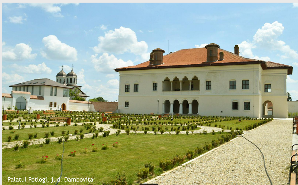
Palatul Potlogi, jud. Dâmbovița

Buletin Informativ nr. 285 / 18 - 24 iulie 2016