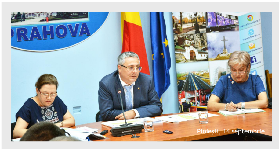
Ploiești, 14 septembrie

» Agenția pentru Dezvoltare Regională Sud Muntenia, în calitate de Organism Intermediar pentru POR, a organizat în perioada 13 - 20 septembrie o caravană de informare pentru promovarea oportunităților de finanțare lansate în cadrul Programului Operațional Regional.