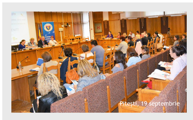
Pitești, 19 septembrie

Astfel, în vederea sprijinirii potențialilor aplicanți de la nivelul regiunii noastre, în cadrul seminariilor de informare au fost oferite detalii importante și de actualitate despre tipurile de activități eligibile ce pot fi realizate prin proiecte de investiții ce vizează reabilitarea termică a clădirilor rezidențiale și publice (P.I. 3.1 A și B), reducerea emisiilor de carbon în zonele urbane (A.P. 3, P.I. 4e, O.S. 3.2), dezvoltarea patrimoniului natural și cultural (P.I. 5.1 - SUERD), revitalizarea orașelor (P.I. 5.2 - POR/ SUERD), modernizarea drumurilor județene (P.I. 6.1 - SUERD), dezvoltarea infrastructurii de turism (P.I. 7.1 - POR/ SUERD), îmbunătățirea infrastructurii serviciilor sociale pentru persoanele cu dizabilități și copii, precum și investiții pentru reabilitarea unităților de primiri urgențe (P.I. 8.2).