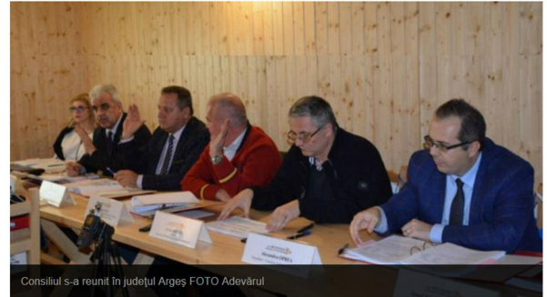
Consiliul s-a reunit în județul Argeș

Până în prezent, regiunea Sud Muntenia are un număr de 811 aplicații depuse în cadrul POR 2014 – 2020 ce totalizează o valoare de aproape 4 miliarde de lei, din care peste 3 miliarde de lei reprezintă valoarea totală solicitată de potențialii beneficiari din fondurile nerambursabile (FEDR și bugetul de stat).