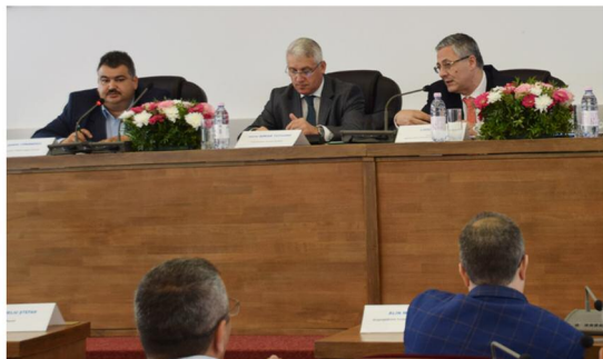
La nivelul Reziunii Sud Muntenia, au fost depuse până acum 880 de aplicații în cadrul POR