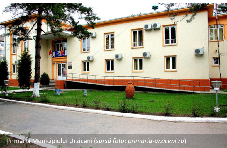
Primăria Municipiului Urziceni