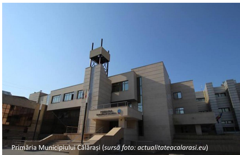
Primăria Municipiului Călărași