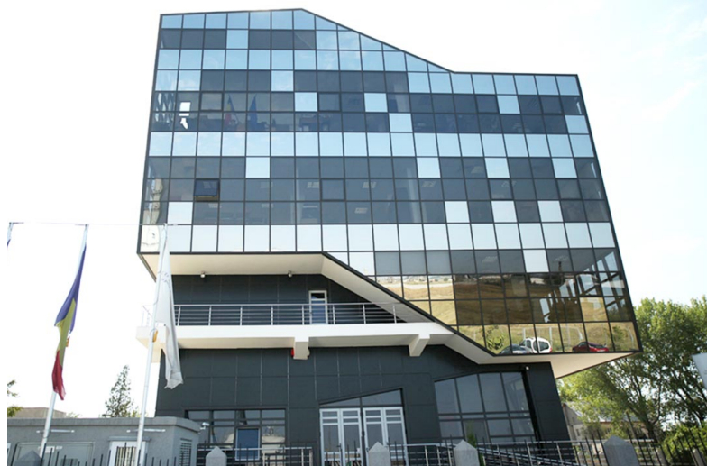
Sediul ADR Sud Muntenia

Documentul poate fi consultat pe site-ul destinat planificării regionale, www.adrmuntenia.ro , secțiunea > Planificare regională > Planificare regională 2021-2027, accesând linkul următor: https://adrmuntenia.ro/index.php/download_file/article/555/corrigendum-1-Apel-2-ADR%20SM.pdf .