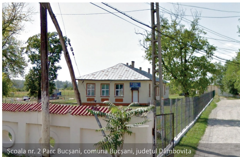
Școala nr. 2 Parc Bucșani, comuna Bucșani, județul Dâmbovița

le includ și aplicația al cărei beneficiar unic este ANCP, în cadrul Axei prioritare 11 – „Extinderea geografică a sistemului de înregistrare a proprietăților în cadastru și cartea funciară”, și care are o valoare totală de aproape 1,44 de miliarde de lei, respectiv o valoare nerambursabilă de peste 1,22 miliarde de lei.