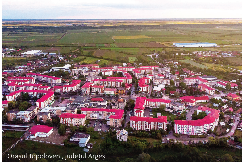
Orașul Topoloveni, județul Argeș

La nivelul regiunii de dezvoltare Sud – Muntenia au fost transmise până acum 2.087 cereri de finanțare care au o valoare totală de 20,4 miliarde de lei, solicitând fonduri publice de peste 14,33 miliarde de lei. Pentru 804 dintre ele au fost semnate contracte de finanțare în valoare totală de 8,37 miliarde de lei și fonduri nerambursabile solicitate de 7,12 miliarde de lei. Sumele includ și aplicația al cărui beneficiar unic este ANCP, I