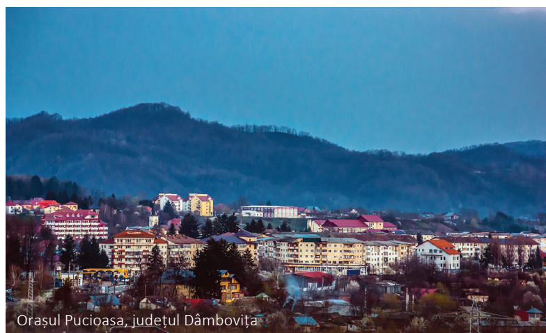
Orașul Pucioasa, județul Dâmbovița

de milioane de lei reprezintă finanțarea din Fondul European pentru Dezvoltare Regională, 3,08 milioane de lei este suma primită de la Bugetul Național, iar 3,18 milioane de lei este contribuția beneficiarului.