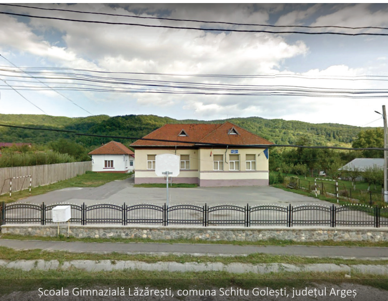
Școala Gimnazială Lăzărești, comuna Schitu Golești, județul Argeș