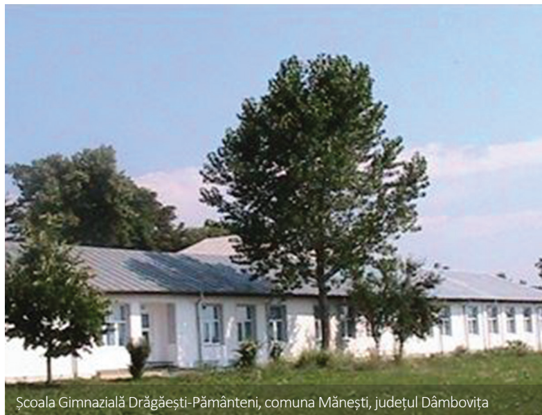
Școala Gimnazială Drăgăești-Pământeni, comuna Mănești, județul Dâmbovița

La nivelul regiunii de dezvoltare Sud – Muntenia au fost transmise până acum 2.087 cereri de finanțare care au o valoare totală de 20,41 miliarde de lei, solicitând fonduri publice de peste 14,33 miliarde de lei. Pentru 804 dintre ele au fost semnate contracte de finanțare în valoare totală de 8,37 miliarde de lei și fonduri nerambursabile solicitate de 7,1 miliarde de lei. Sume-