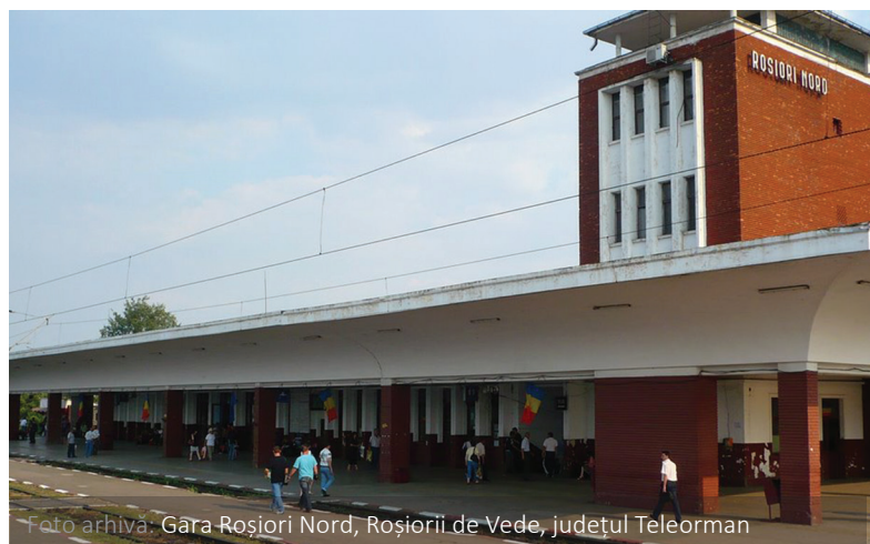
Foto arhivă: Gara Roșiori Nord, Roșiorii de Vede, județul Teleorman