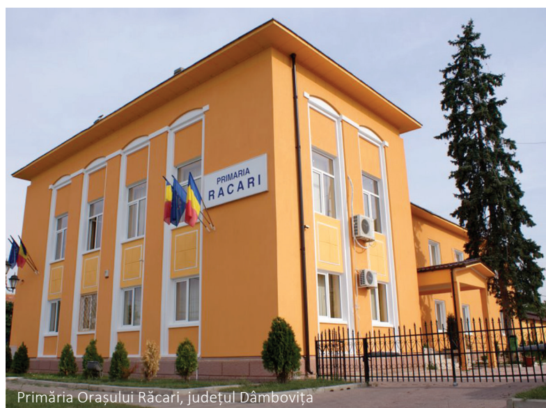
Primăria Orașului Răcari, județul Dâmbovița

în cadrul Axei prioritare 11 – „Extinderea geografică a sistemului de înregistrare a proprietăților în cadastru și cartea funciară”, și care are o valoare totală de aproape 1,44 de miliarde de lei, respectiv o valoare nerambursabilă de peste 1,22 miliarde de lei.