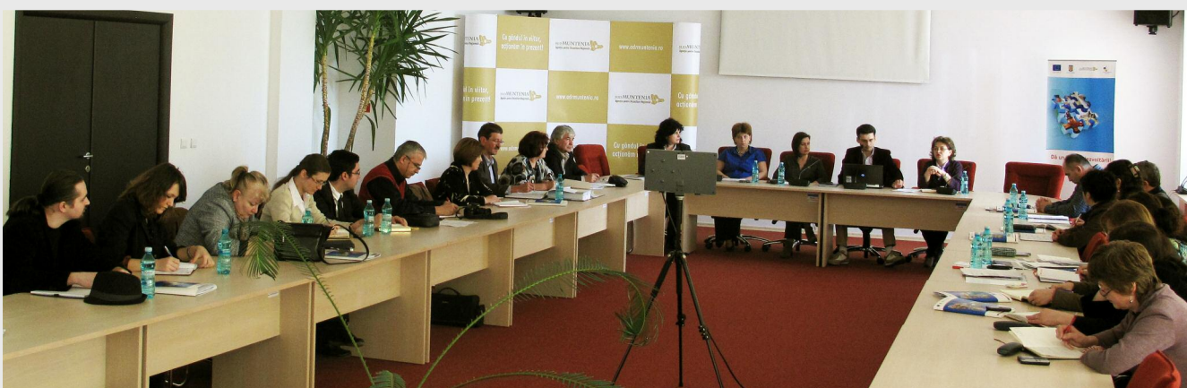
La seminarul organizat la sediul central al ADR Sud Muntenia au participat echipele de implementare a proiectelor finanțate din fonduri Regio