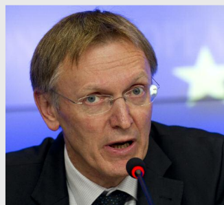
Janez Potocnik, comisarul european pentru schimbări climatice