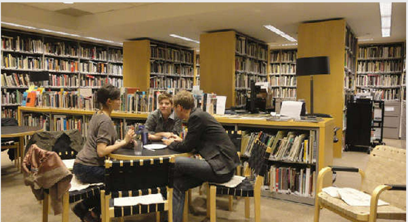
Biblioteca ar urma să fie construită în imediata vecinătate a Consiliului Județean Călărași