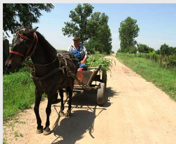
Consiliul Județean Giurgiu are în vedere și asfaltarea DJ 603, Comana-Naipu