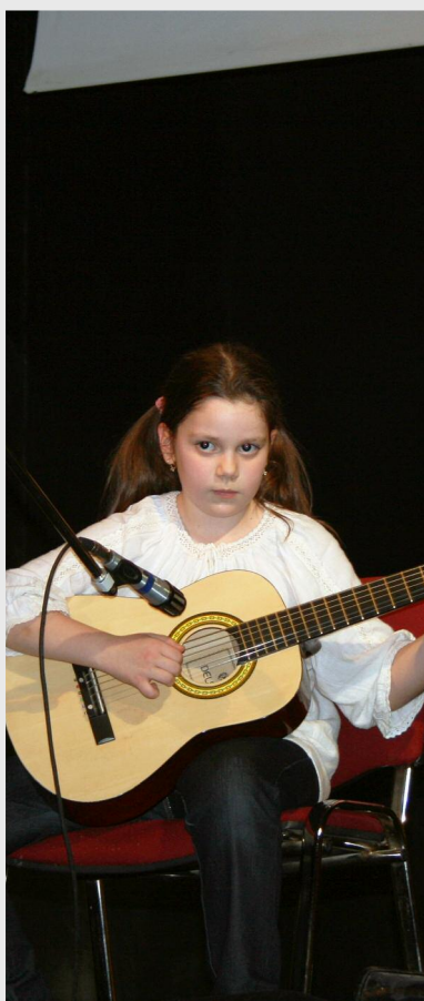
Cei mici au încântat audiența cântând la chitară