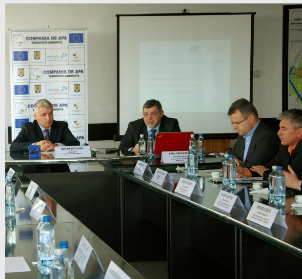
Contractul a fost semnat la Primăria Găești în data de 28 februarie