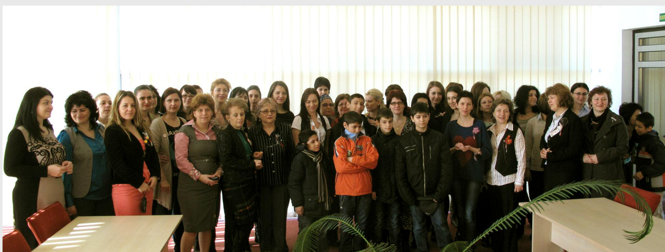
Copiii de la Centrul SERA au oferit doamnelor și domnișoarelor de la ADR mărțișoare confecționate chiar de ei