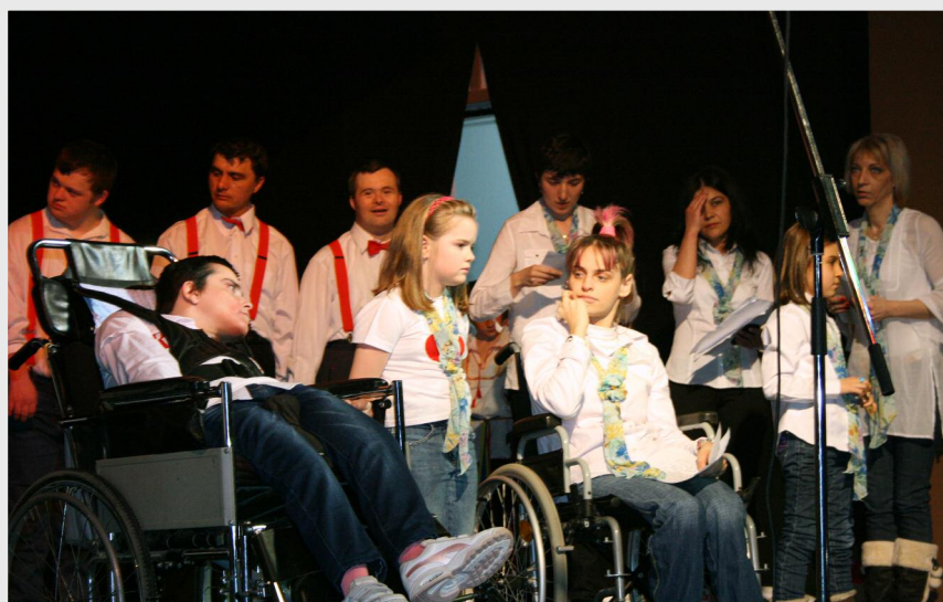
Au fost prezentate momente artistice presărate cu poezie, muzică și dans