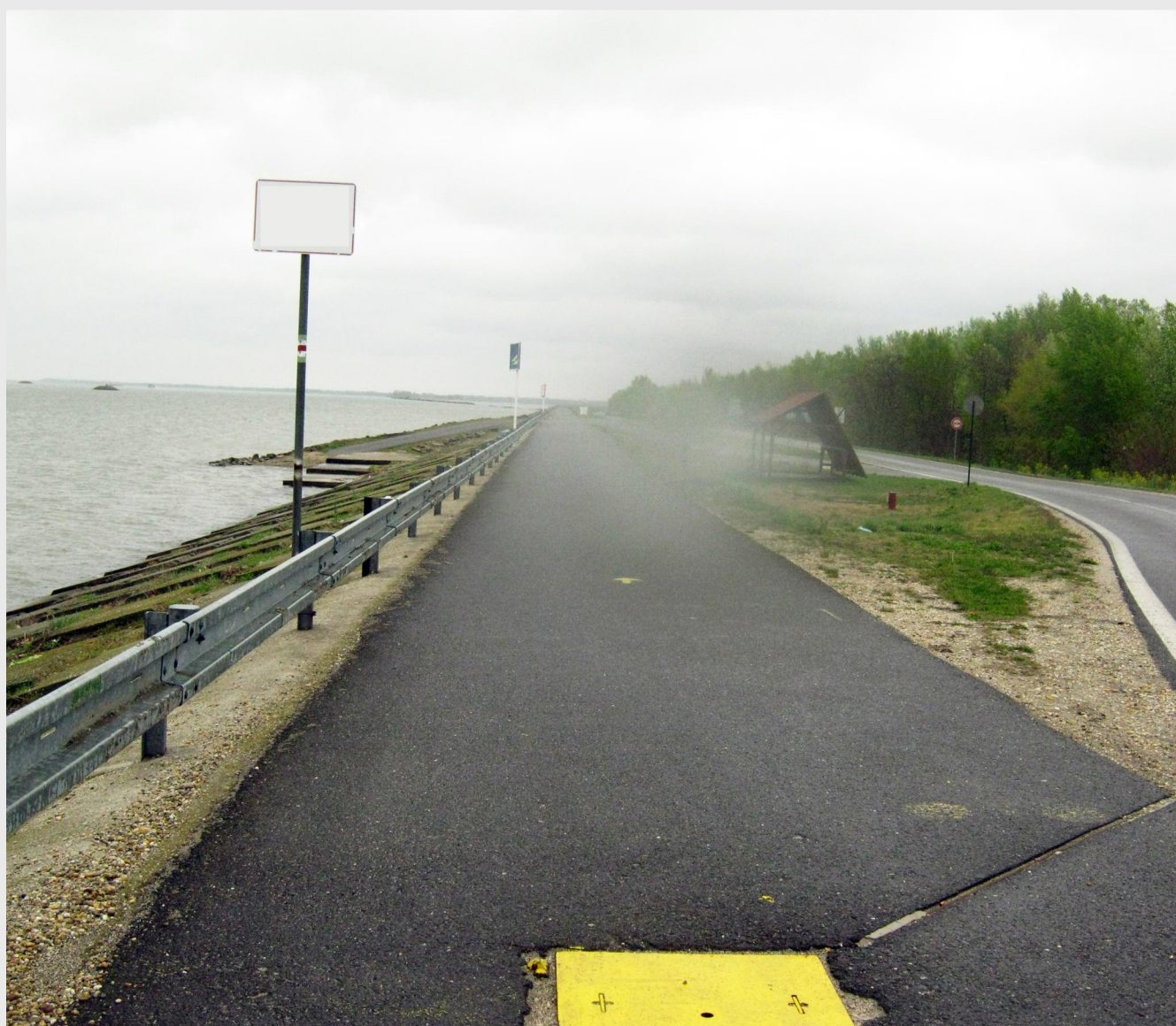
Pistele de ciclism ar putea deveni realitate de-a lungul Dunării, pe teritoriul județului Ialomița