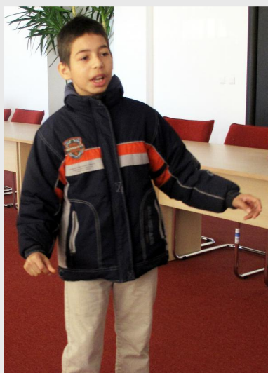
Pe lângă mărțișoare, angajatele ADR au fost plăcut surprinse și de programul artistic oferit de unul din copiii de la SERA

Mulțumim mult pentru zâmbetele calde de primăvară aduse de copiii de la SERA!!!