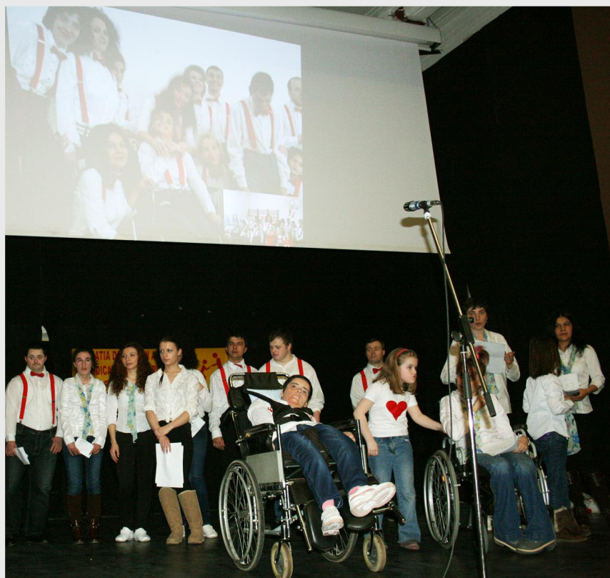
În deschiderea spectacolului, copiii de la Asociația de Sprijin a Copiilor cu Handicap Fizic România - Filiala Călărași au prezentat un frumos program artistic

Agencia pentru Dezvoltare Regională Sud Muntenia a fost alături de Asociația de Sprijin a Copiilor cu Handicap Fizic România (ASCHF-R) - Filiala Călărași la un eveniment pe care membrii Asociației l-au organizat la sfârșitul lunii februarie la sala Teatrului „Aurel Elefterescu” din Călărași. Pentru cei prezenți, ASCHF-R Filiala Călărași și elevi ai unor școli din Călărași au pregătit momente artistice, ce ne-au adus aminte că viața înseamnă prietenie și solidaritate cu cei mai puțin norocoși.