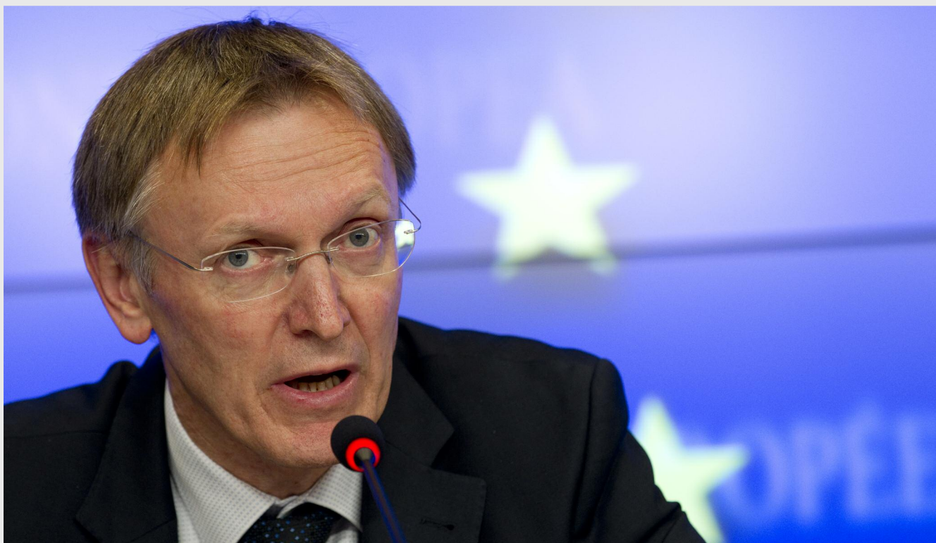
Janez Potocnik, comisarul european pentru schimbări climatice