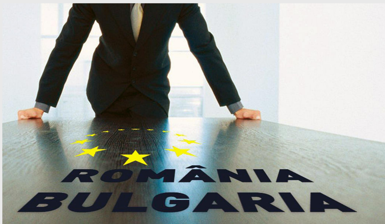
A doua întâlnire a Grupului Comun de Lucru va avea loc la Ruse, Bulgaria, pe 12 martie