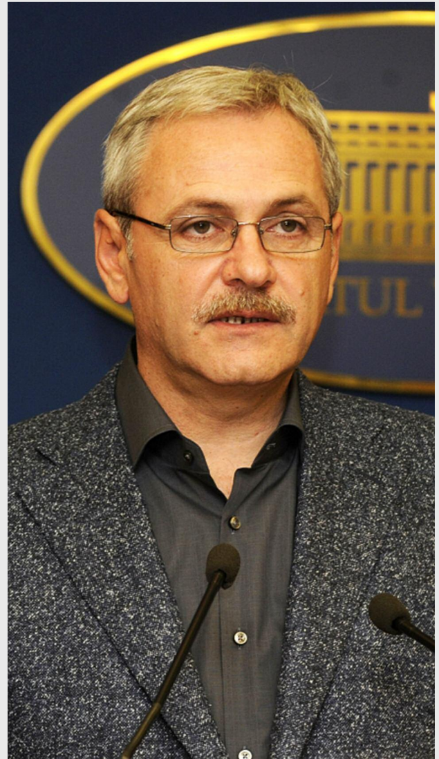
Liviu Dragnea, vicepremierul României

„Aștept toate autoritățile locale să aibă deja documentațiile făcute conform ghidului, care este public, în așa fel încât imediat, de a doua zi de când primim aprobarea de la Comisie, să putem depune proiecte. Nu mai vrem ca, în acest exercițiu financiar, să mai existe ani pierduți. Pentru că am avut, din păcate, până în 2012, de exemplu, la noi, la POR, absorbție de 656 de milioane în șase ani, deci o medie de 100 de milioane de euro pe an, și, când am preluat, am ajuns la absorbție de 1,2 miliarde de euro pe an. Ani pierduți pentru dezvoltare. Acum avem toate condițiile, toate procedurile simplificate, pentru ca imediat, în noiembrie, să poată să fie depuse proiecte.”, a precizat Liviu Dragnea.