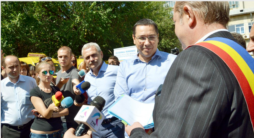
Înmânarea contractului de finanțare pentru realizarea proiectului „Fermă Grup Școlar Agricol”