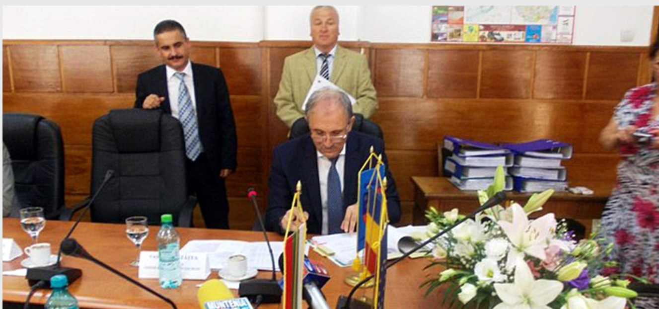
Vasile Mustăța, președintele Consiliului Județean Giurgiu