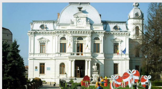
Primăria Municipiului Târgoviște