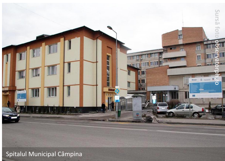
Spitalul Municipal Câmpina

Beneficiarul de fonduri Regio, Primăria Municipiului Câmpina, are ca obiectiv îmbunătățirea infrastructurii medicale, prin creșterea eficienței energetice a Spitalului Municipal Câmpina. Astfel, prin acest demers corpul C al clădirii Spitalului Municipal Câmpina va avea o performanță energetică îmbunătățită, trecând de la clasa energetică C la clasa energetică A, nivelul anual al emisiilor de gaze va fi redus cu minimum 40% și consumul anual de energie primară aferent clădirii spitalului va scădea cu minimum 60%. În cadrul proiectului sunt prevăzute lucrări de intervenție, precum: termoizolarea și eficientizarea energetică, modernizarea instalațiilor electrice, de iluminat și a sistemelor de climatizare, implementarea sistemelor de management energetic, instalarea sistemelor de panouri fotovoltaice, înlocuirea lifturilor existente, precum și refacerea finisajelor