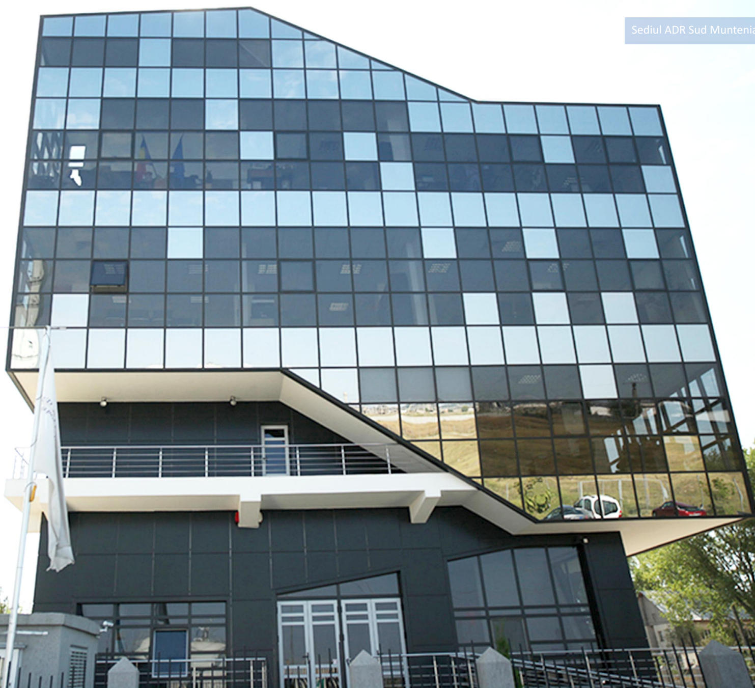
Sediul ADR Sud Muntenia